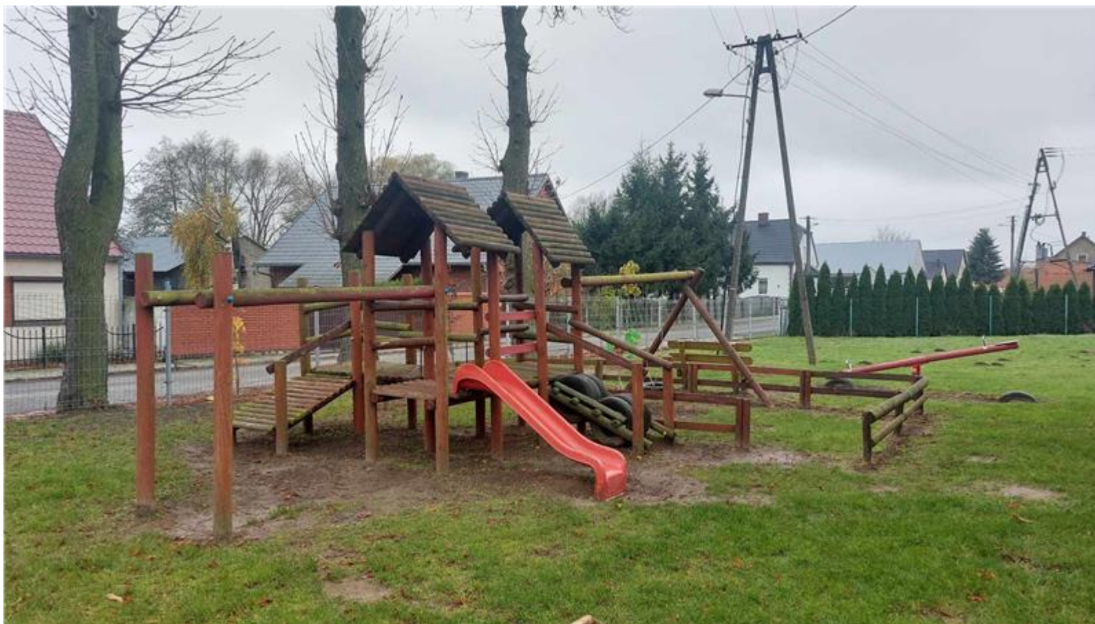
Plac zabaw w Machcinie