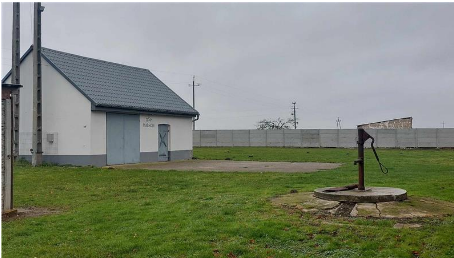
Remiza OSP w Machcinie