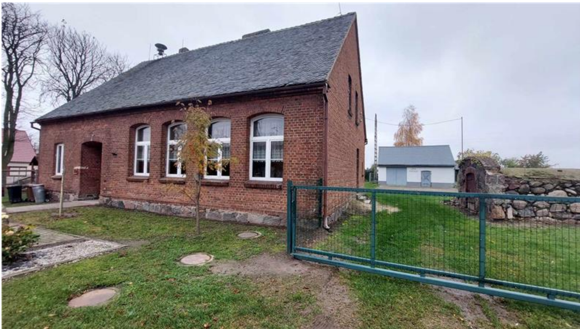
Świetlica wiejska w Machcinie