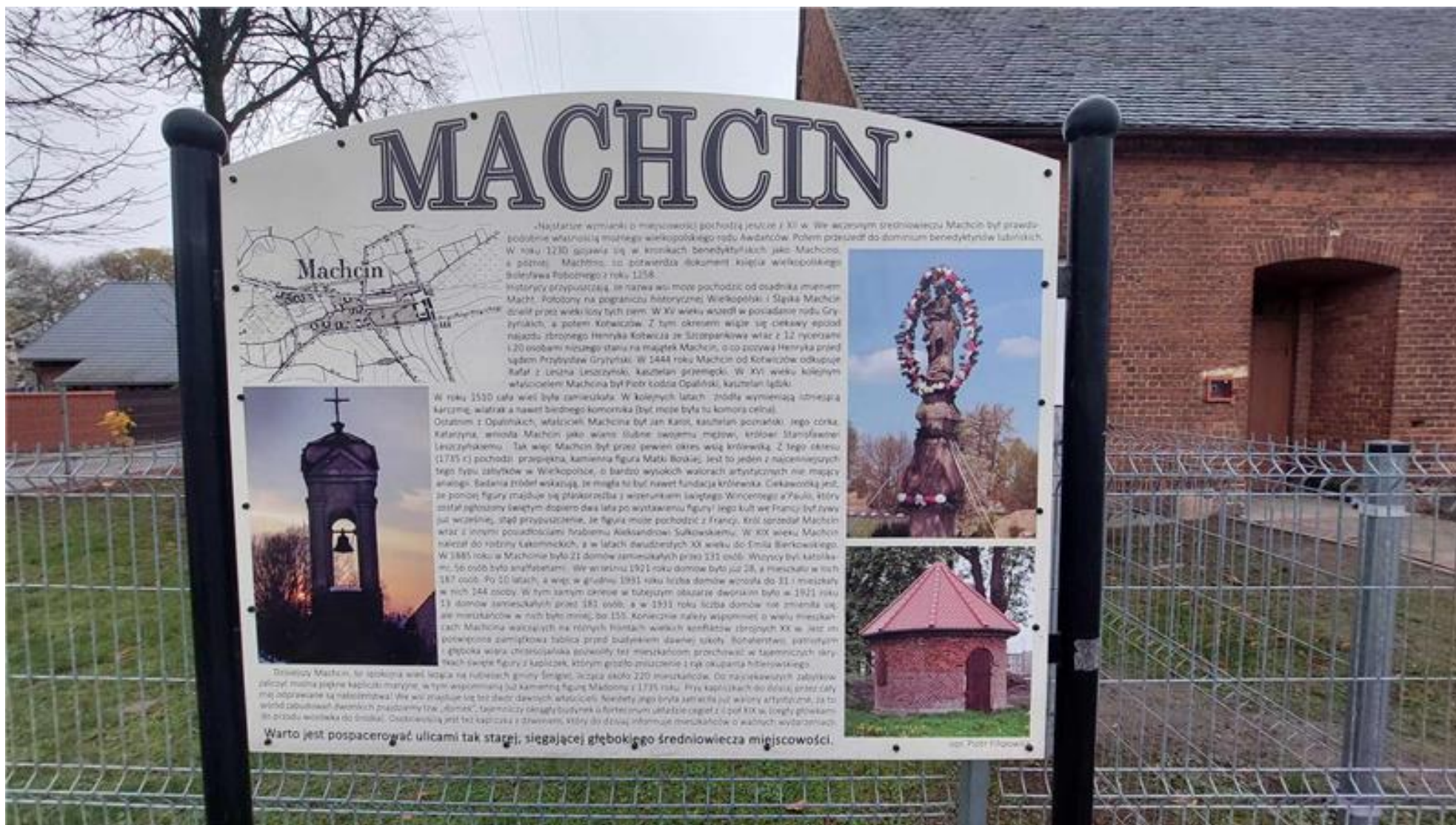
Tablica mówiąca o historii Machcina