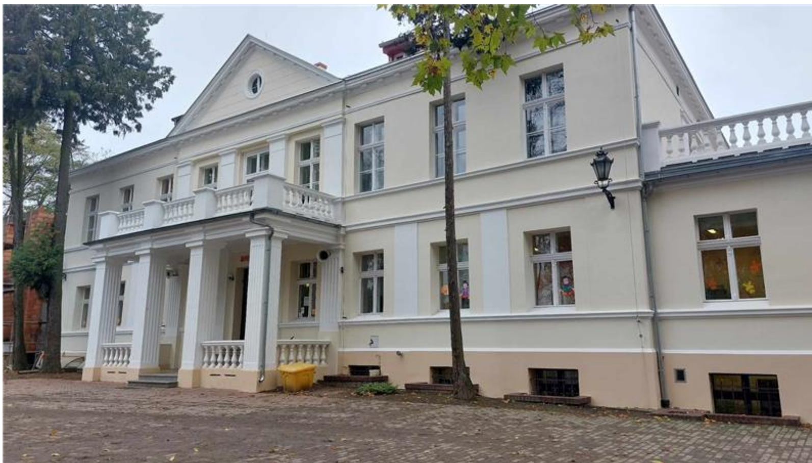
Szkoła w zabytkowym w budynku