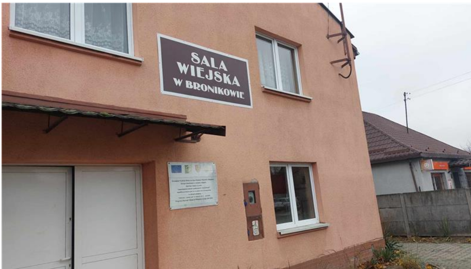
Sala wiejska w Bronikowie