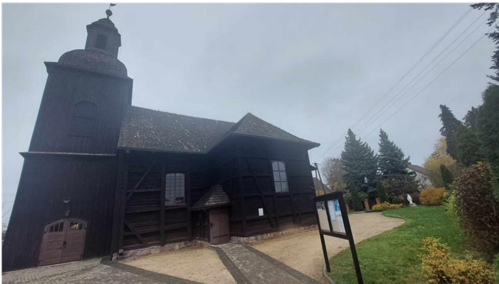
Drewniany kościół z 1739 r.