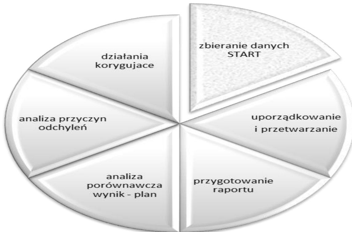
Rysunek 4. Układ działań systemu ewaluacji dla Gminy Śmigiel.

Ocena realizacji Planu polegać będzie przede wszystkim na systematycznej, obserwacji postępów we wdrażaniu.