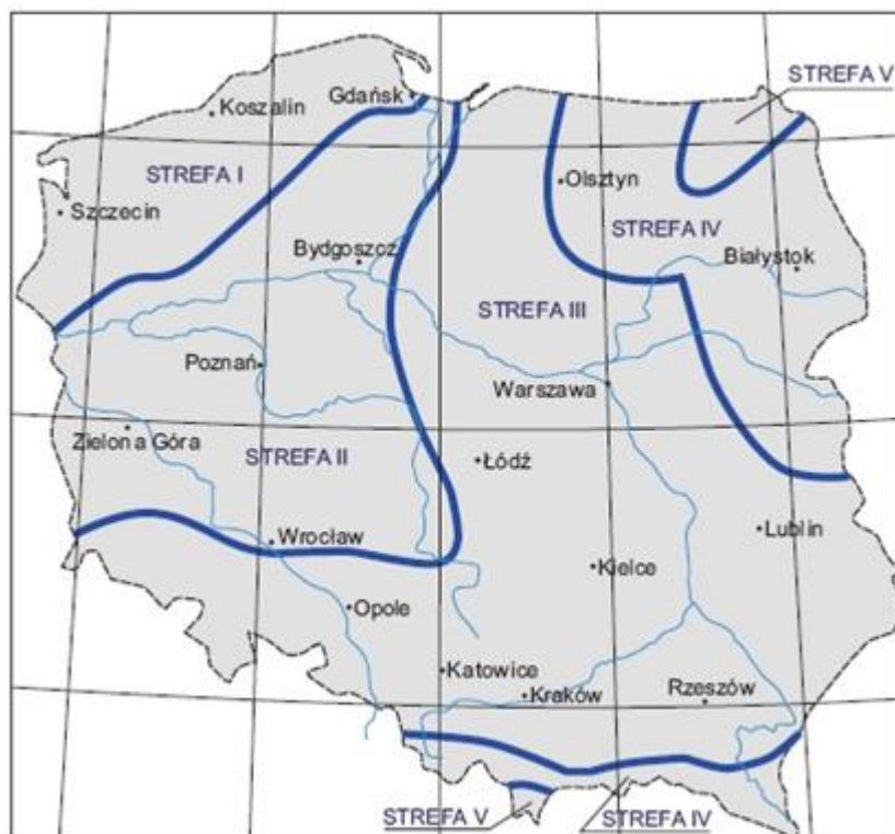
Rysunek 2. Strefy klimatyczne Polski.