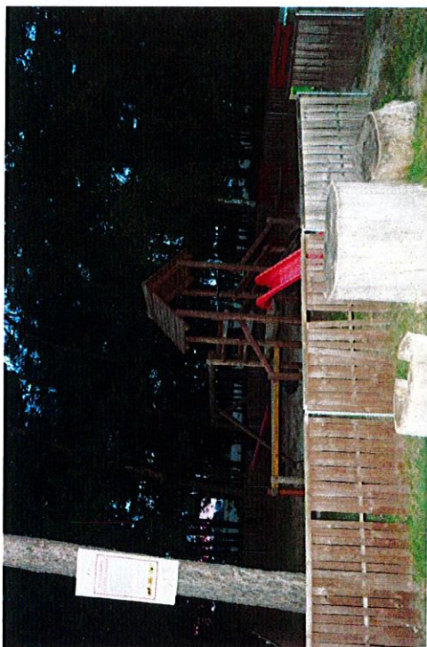
Plac zabaw w Poladowie