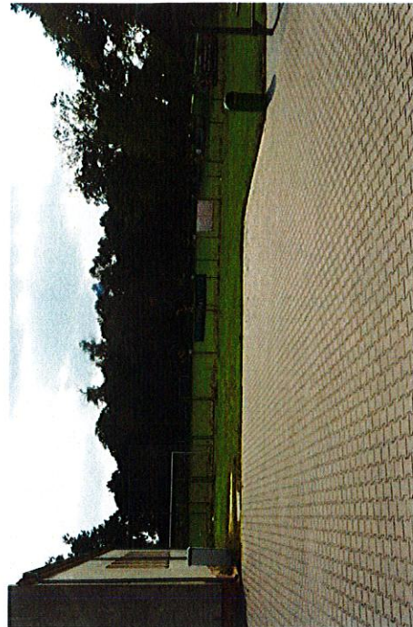
Boisko sportowe w Czaczu