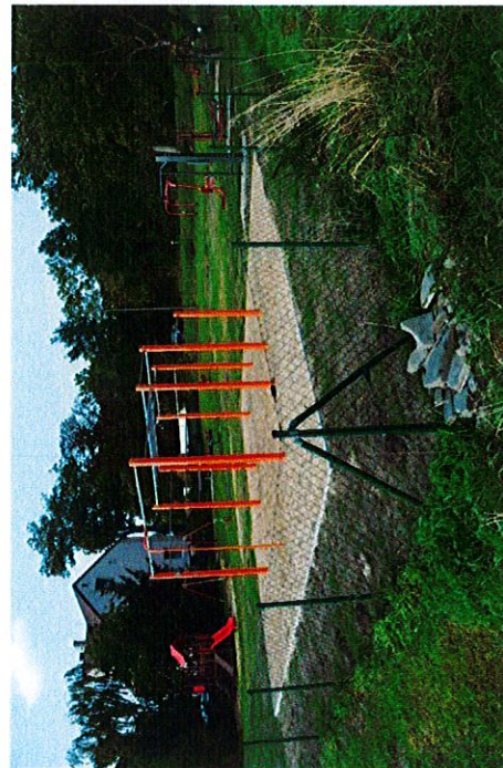
Plac zabaw w Czaczu