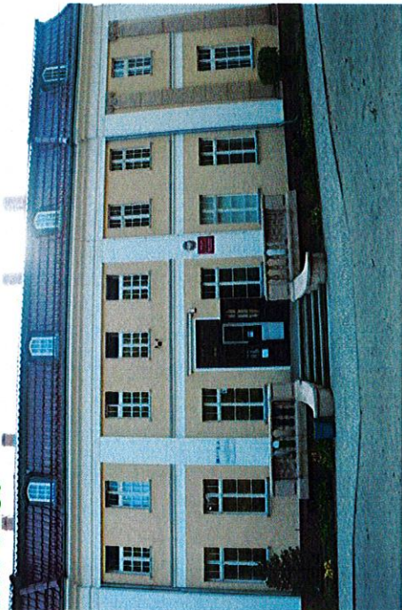
Pałac w Czaczu, dzisiaj Zespół Szkół w Czaczu