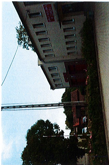
Remiza OSP, sala wiejska, filia biblioteczna