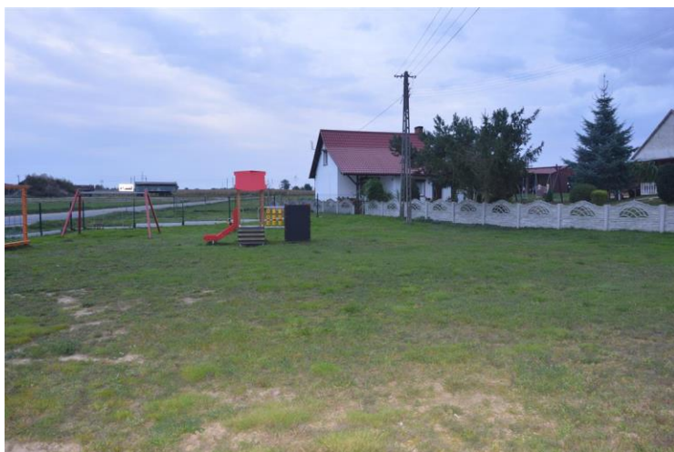
Powstający plac zabaw w Sierpowie