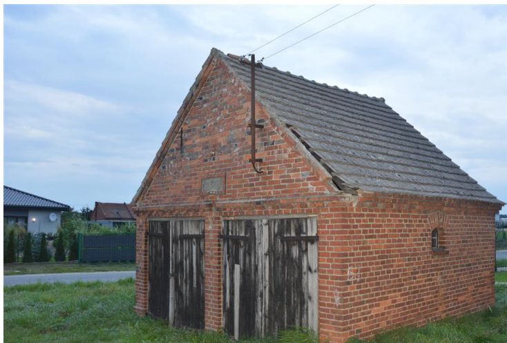
Dawny budynek remizy OSP