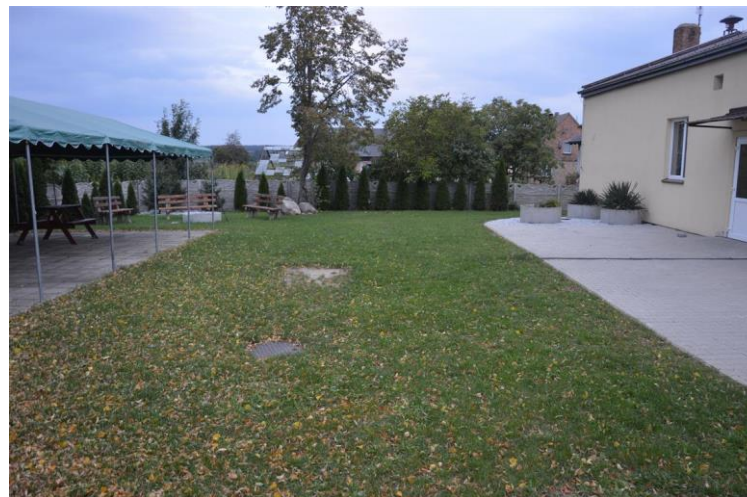
Teren rekreacyjny za salą wiejską w Sierpowie