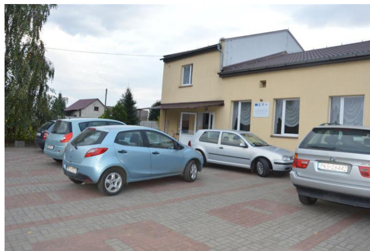
Budynek sali wiejskiej w Sierpowie