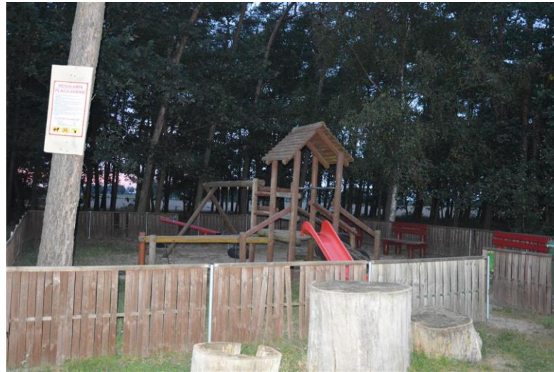
Plac zabaw w Poladowie