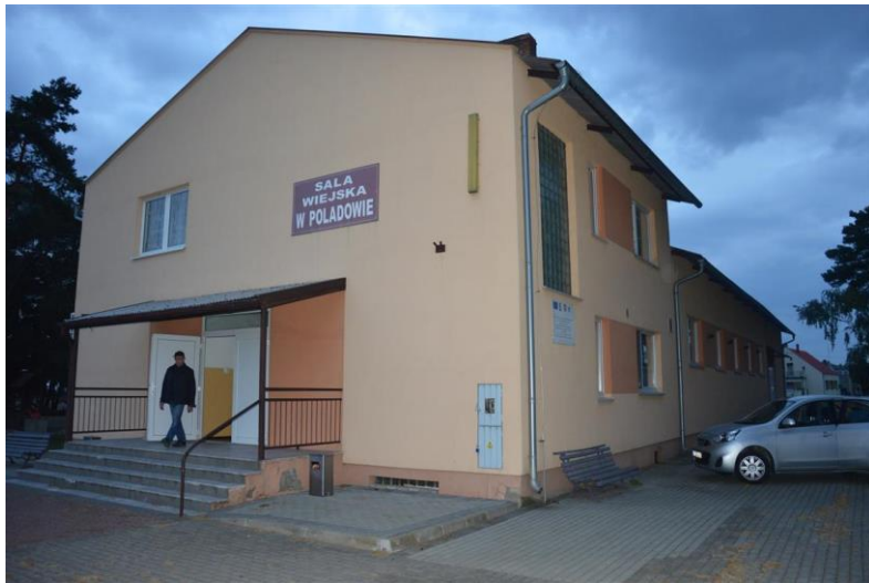
Sala wiejska w Poladowie