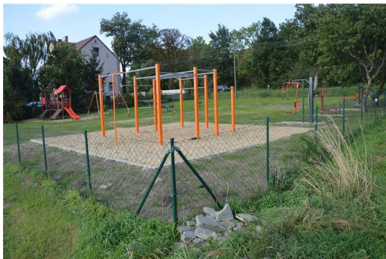
Plac zabaw w Czaczu