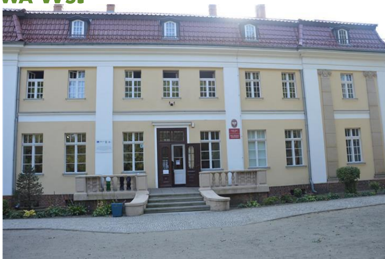
Pałac w Czaczu, dzisiaj Zespół Szkół w Czaczu