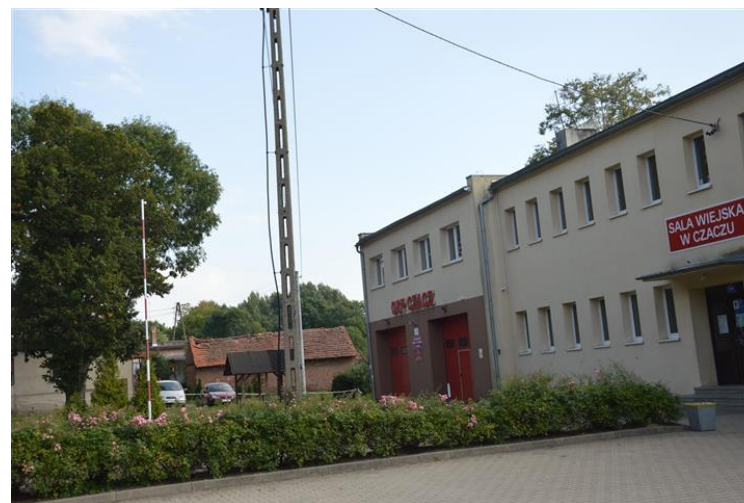
Remiza OSP, sala wiejska, filia biblioteczna