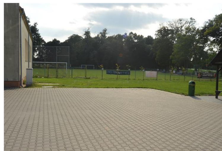
Boisko sportowe w Czaczu